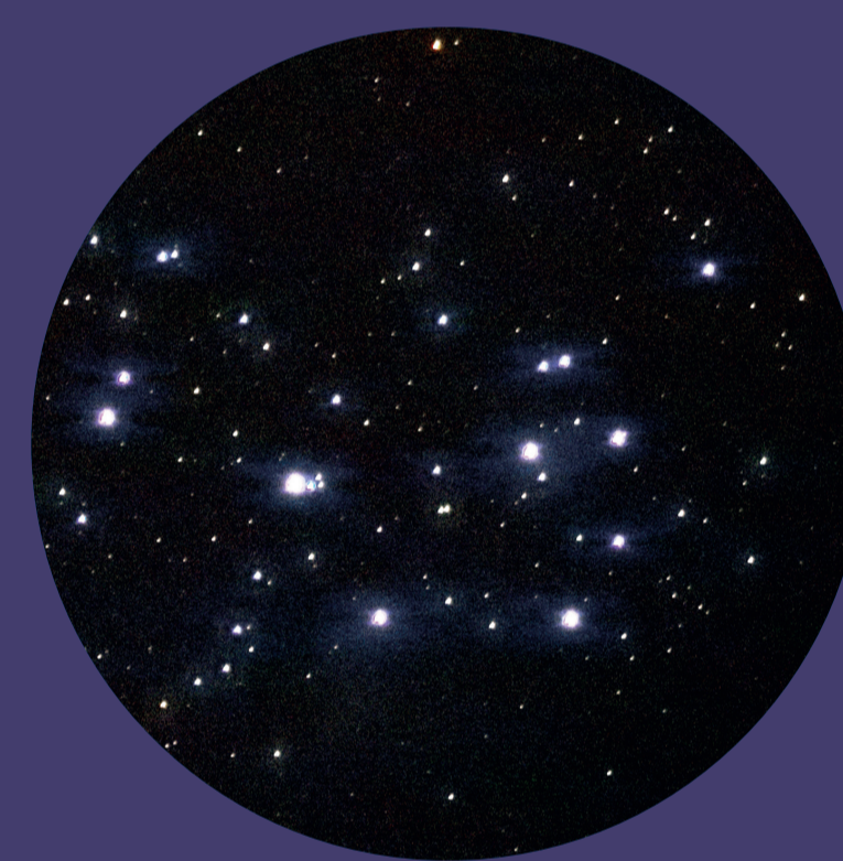
... und durch das Fernglas betrachtet.