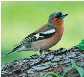
Der Buchfink ernährt sich im Winter von den herabgefallenen Buheckern.

Wir Rotbuchen sind einfach die Besten. Deshalb hat man uns hier im Monschauer Land als Hecken gepflanzt. Unsere Äste wachsen so dicht, dass sich dazwischen jede Menge Laub und Pflanzenreste sammeln. Wenn sie verrotten, düngen sie den Boden. Das unterstützt die Kräuter und Gräser, die im Schutz unseres Heckenkörpers wachsen. Unsere Nordseite ist nicht ganz so beliebt und dem Schatten unseres Laubes sind nur wenige Arten gewachsen. Der Sauerklee ist so einer. Der kommt sehr gut mit wenig Licht aus.