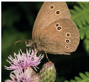
Der Schornefeger saugt Nektar aus einer Kratzdistel, die im Krautsaum der Hecken wächst.

Auf unserer Sonnenseite herrscht dagegen ein buntes Treiben: Ein üppiger Krautsaum mit Gräsern, Kräutern und Blumen bietet Kleintieren wie Schnecken, Spinnen und Insekten Nahrung und Lebensraum. Auch der Schornefeger ist hier oft zu finden. Er saugt als Schmetterling an den Blüten, während seine Raupen lieber Gräser fressen. Die sind allerdings nur nachts unterwegs. Tagsüber ist es zu gefährlich. Da pickt im Sommer der Buchfink alles, was er an Kleingetier finden kann, vom Boden auf. Im Winter, wenn nichts mehr krecht und fleucht, decken wir Rotbuchen dem bunten Vogel den Tisch: Ohne unsere leckeren Buheckern käme er nicht durch die kalte Jahreszeit.